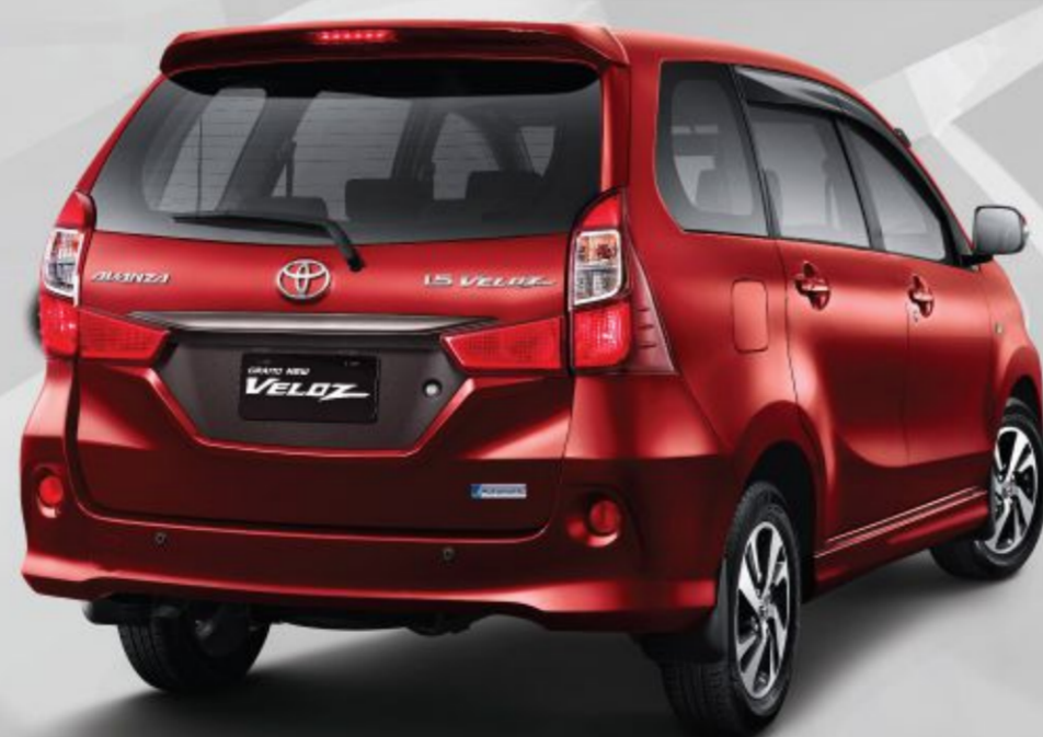
Tipe 1.5 A/T

Salah satu sistem keamanan pada kunci mobil agar terhindar dari pencurian. (Semua Tipe)